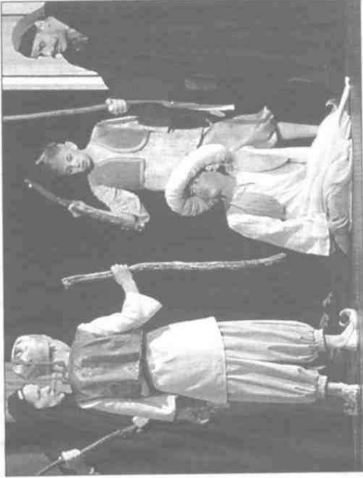
Start einer spannenden Kinderoper: Der kleine Muck wird von seinen knurrenden Verwandten aus dem Haus gejagt.